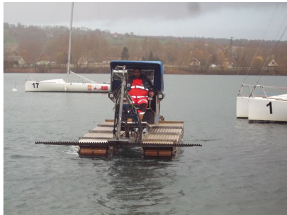
BARRE DE COUPE PROFONDEUR : 1.6M MAX