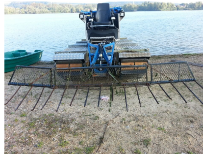
PANIER DE RAMASSAGE